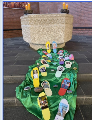
Erstkommunionsfeier am 19. April 2026 in St. Johannes