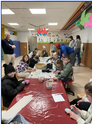
Gemeinschaft erleben auf eine kreative Art: Bemalen der Steine für das Bodenbild für die Erstkommunionsfeier